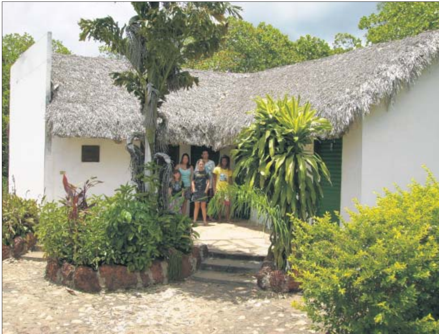
Schulhaus unterm Palmendach: Und vor der Türe steht die ganze Klasse samt Lehrkräften