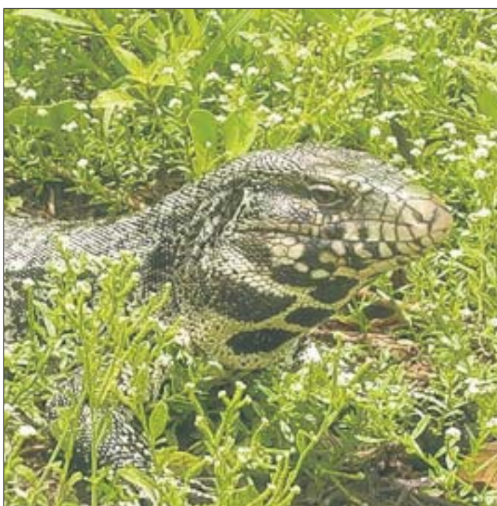
Wird gern von Hunden gejagt: Grausilbriger Waran

Momentan sind alle mitten in den Weihnachtsvorbereitungen. Obwohl wegen des heissen Wetters und des fehlenden Schnees für Schweizer nicht gerade Weihnachtsstimmung aufkommt, werden in der Schule fleissig Weihnachtslieder gesungen und Kerzen angezündet. Natürlich werden auch Guetzli gebacken, Geschenke gebastelt und ein Baum geschmückt – wie in der Schweiz, einfach bei 35 Grad im Schatten.